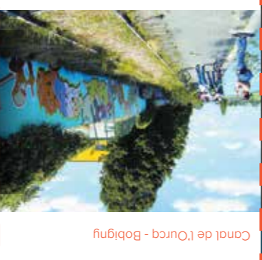
Canal de l'Ourcq - Bobigny