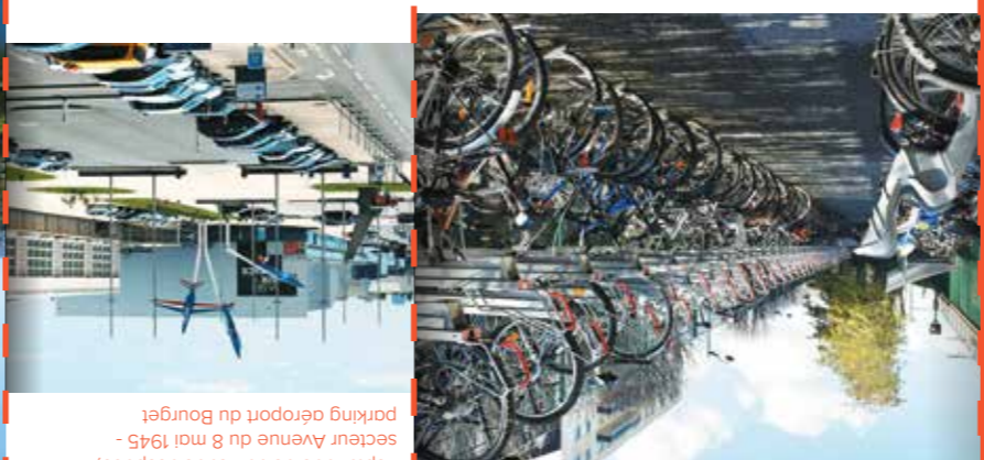
Esplanade de l'air et de l'espace, secteur Avenue du Bourget, parnny atropou du Bourget