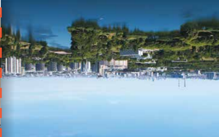
Lac de Créteil - GPECA