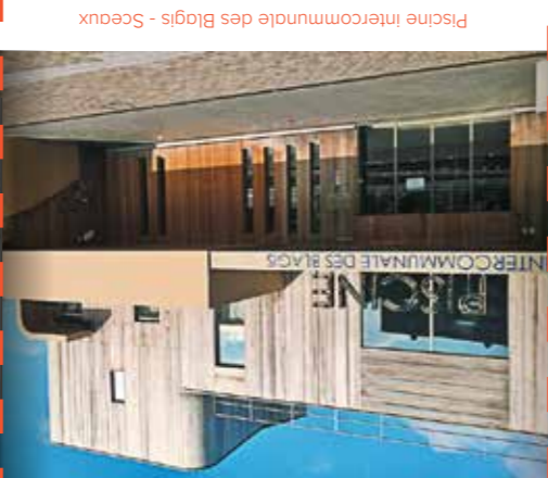
Plaine intercommunale des Biogs - Sceaux