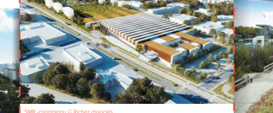
SMR -champigny

• Grand Paris Sud Est Avenir aménagé, à Créteil, le quartier Duvauchelle qui accueillera le siège de la Fédération française de handball pour un montant de 8 M€ avec le déploiement d'un complexe hôtelier et d'un programme de bureaux d'envergure.