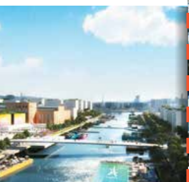
ZAC Campus Grand Parc, Villejuif

Les EPT sont les moteurs de l'innovation urbaine et de l'attractivité de la dynamique métropolitaine. En effet, ils sont au premier plan de l'aménagement des quartiers de gare et des hubs en vue de l'arrivée du Grand Paris Express. Ils sont les acteurs de la construction de la ville de demain et des smart cities.