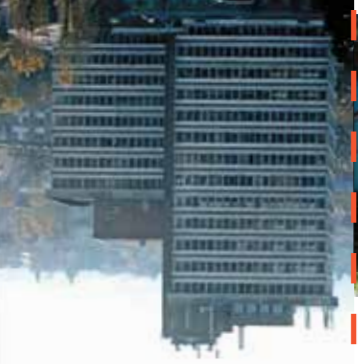
Projet Villa Médicus - Clichy / Montfermeil

Les Territoires, aires urbaines de 300 000 habitants réalisent des économies de proximité dont ils ont la charge, les services publics de proximité sont la gestion des commandes sur des domaines variés : équipements culturels et sportifs. L'importance de leurs volumes d'achats leur permet de bénéficier de nombreux équipements, en commun de moyens au niveau d'un Territoire permet aussi aux villes de bénéficier de nombreux équipements, sans supporter la totalité de l'investissement et, réduisant les coûts de fonctionnement (frois d'entretien, assurances...).