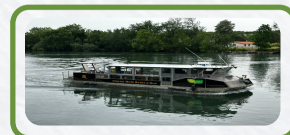
Bateau «Coche d'eau» - 25 places