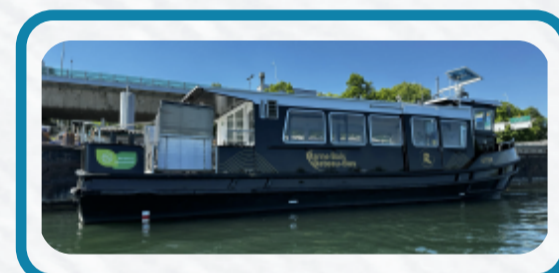
Bateau «Otter» - 100 places

À bord du bateau « Otter », tous les arrêts sont adaptés aux personnes en situation de handicap. Sauf Joinville RER