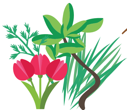
Feuilles, fleurs fanées