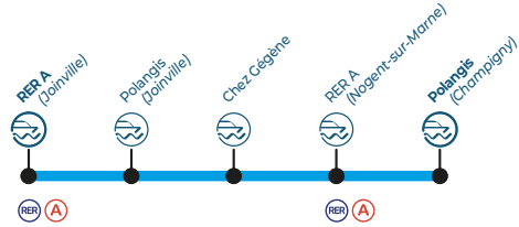
Le bateau «côche d'eau»