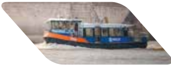
100 places - Les vélos sont acceptés