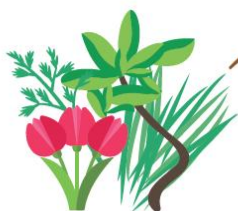
Feuilles, fleurs fanées

QUELS SONT LES DÉCHETS ALIMENTAIRES À DÉPOSER DANS LE BIOSEAU ?