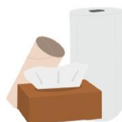
Essuies-tout, mouchoirs, rouleaux en carton