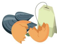
Thé et café, coquilles d'oeuf et coquillages

#FLEURS FANÉES #FEUILLES #ESSUIES-TOUT #MOUCHOIRS #ROULEAUX EN CARTON #ÉPLUCHURES BIOSEAU #FRUITS #LÉGUMES #RESTE DE REPAS #THÉ #CAFÉ #COQUILLES D'OEUF