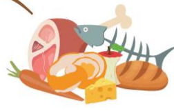
Épluchures, fruits/légumes et restes de repas (viande, poisson, gâteau, fromage, pain)