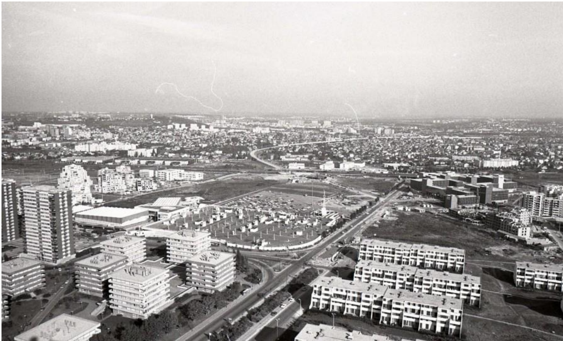
Vue vers la gare Val de Fontenay depuis la ZUP, 1977

Constitué sur les fondements d'un urbanisme de dalle, peu lisible, essentiellement minéral et subissant aujourd'hui un bâti vieillissant, le quartier est amené à muter durant les 15 prochaines années, en lien notamment avec l'arrivée des lignes M1, M15 Est et du T1.