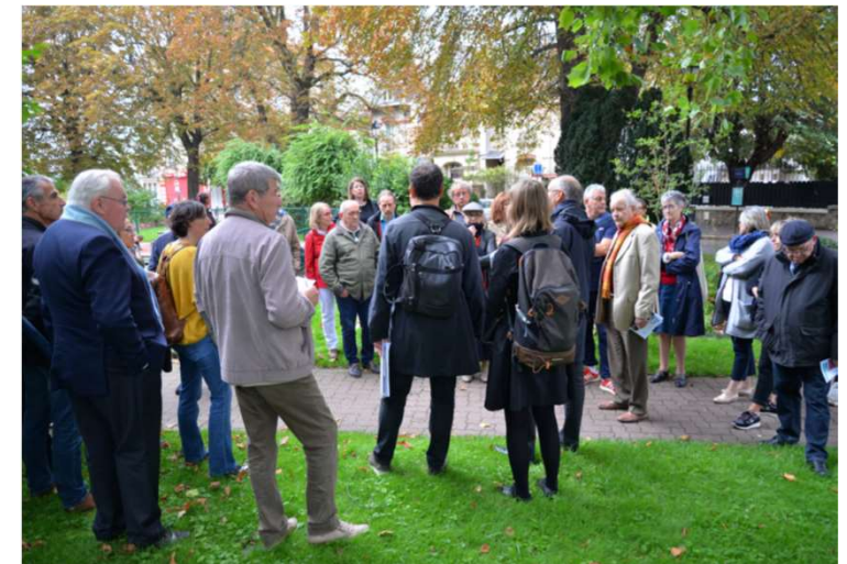
Balade urbaine le long de l'avenue Gallieni, 26 septembre 2019