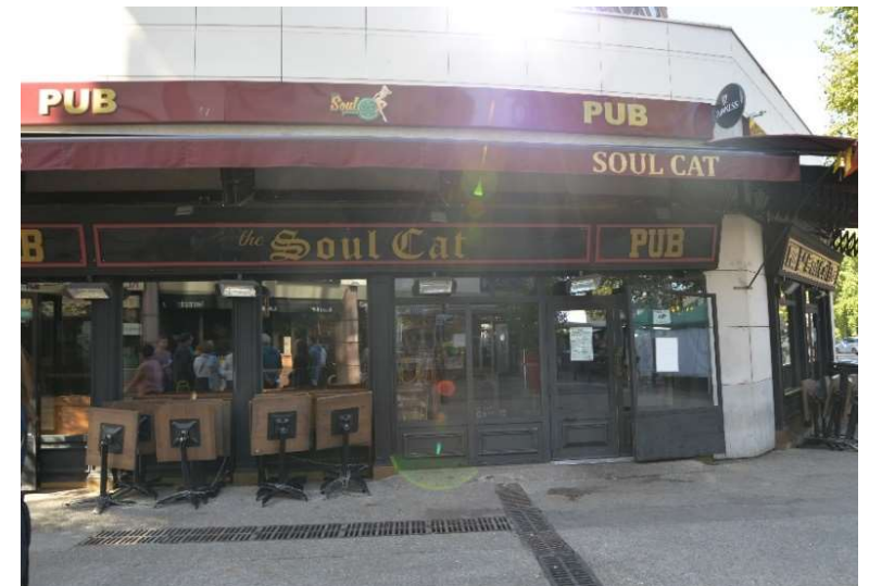
PUB « Soul Cat » sur l'allée Raymond Nègre