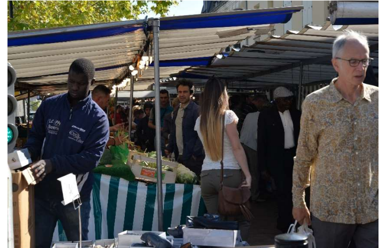
Animation lors du jour de marché