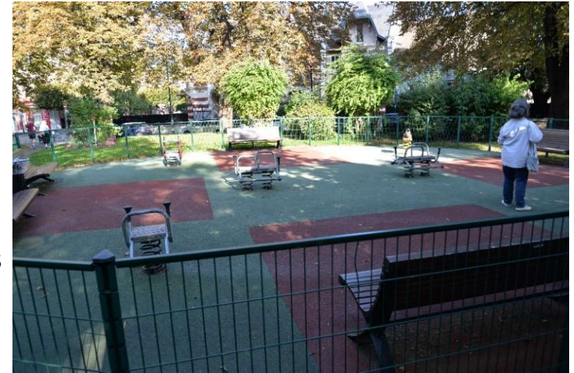
Le square de la place de Verdun