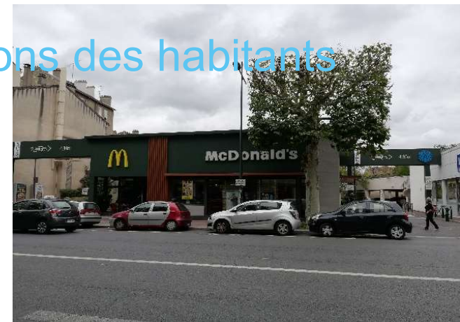
MC Donald's et Picard