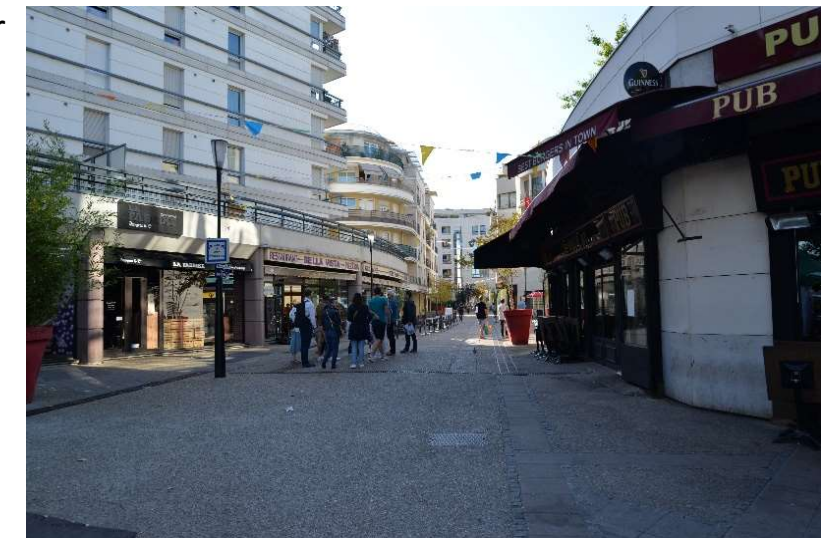
L'allée Raymond Nègre