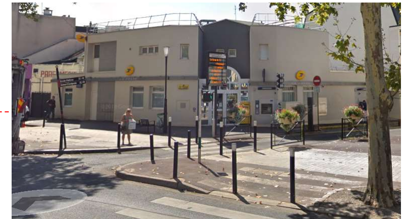
Architecture disgracieuse et mal intégrée (Poste)