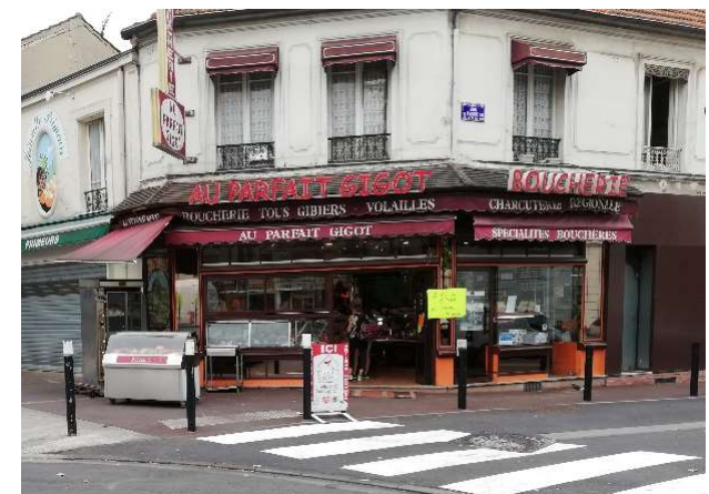
Commerces rive sud