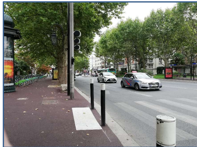
Le début de l'avenue Gallieni côté Place de Verdun