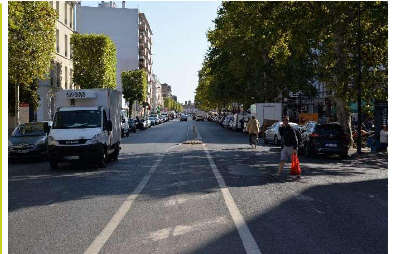
Avenue Gallieni juste après la Place de Verdun vers l'Est