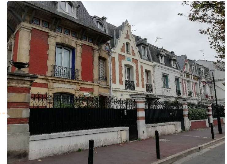
Architecture patrimoniale de qualité