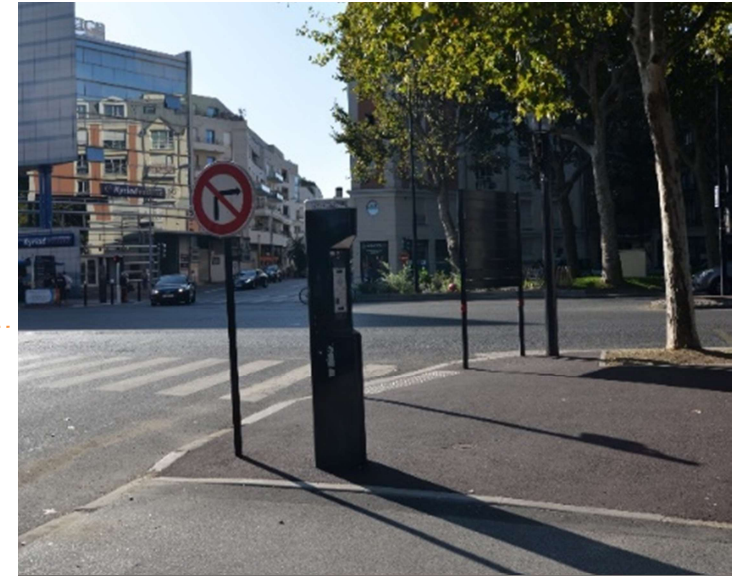
La borne de taxis longeant la place de Verdun