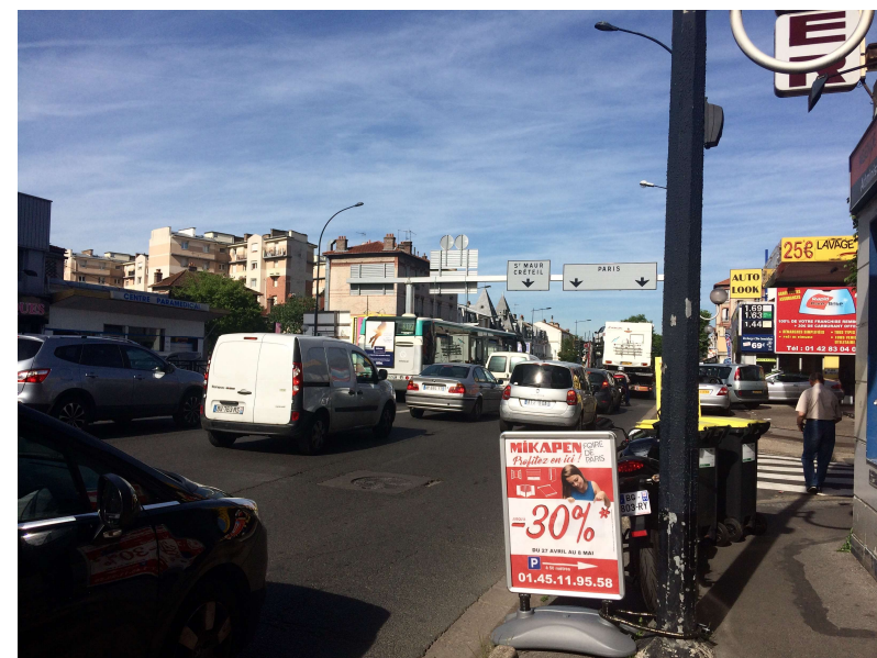
La Fourchette en allant vers Joinville le Pont

(nécessaire association du Département et de Champigny pour engager une réflexion sur ce secteur)