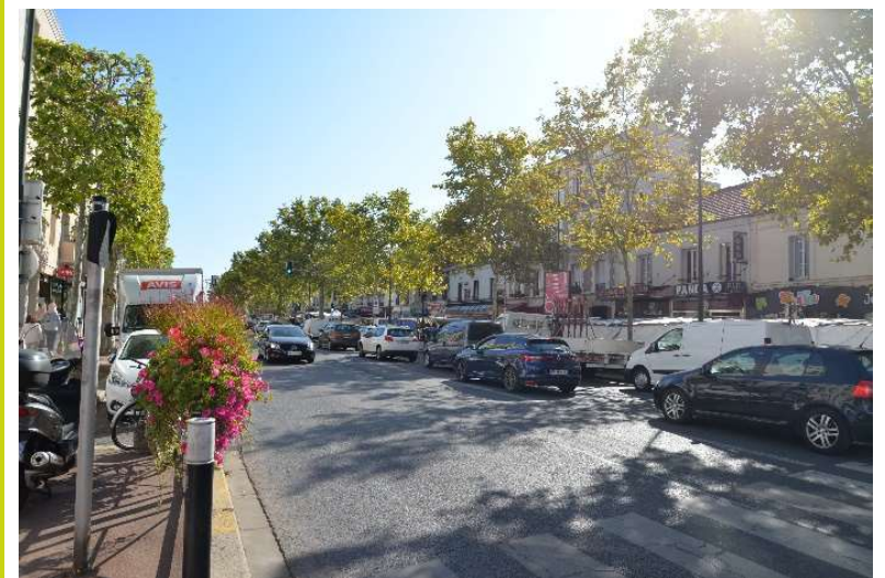
Avenue Gallieni à la hauteur du marché toujours vers l'Est