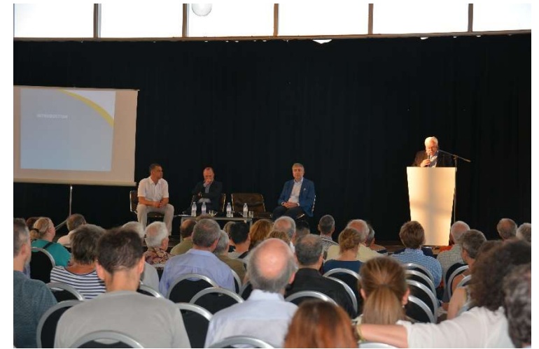
Réunion publique de lancement, mairie de Joinville-Le-Pont, 26 juin 2019